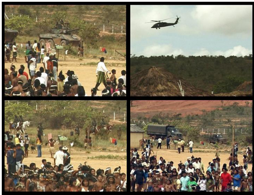
Figura 12 – Comunidade indígena em constante estado de vigilância. TI Raposa Serra do Sol.