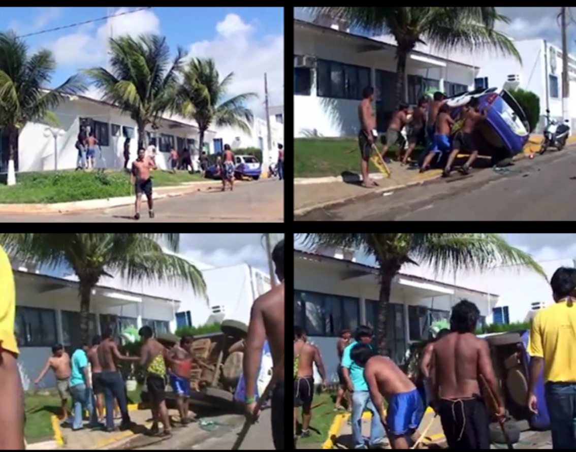
Figura 09 – Indígenas Xavante realizam ação na delegacia de Primavera do Leste, MT.