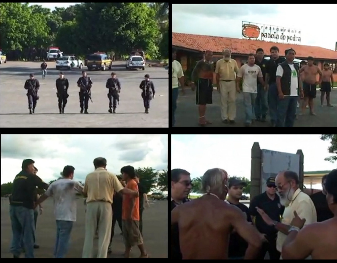
Figura 10 – Negociação entre Xavante e a Polícia Federal.

Fonte: Frames do filme Prisão e libertação de jovem xavante , 2009.