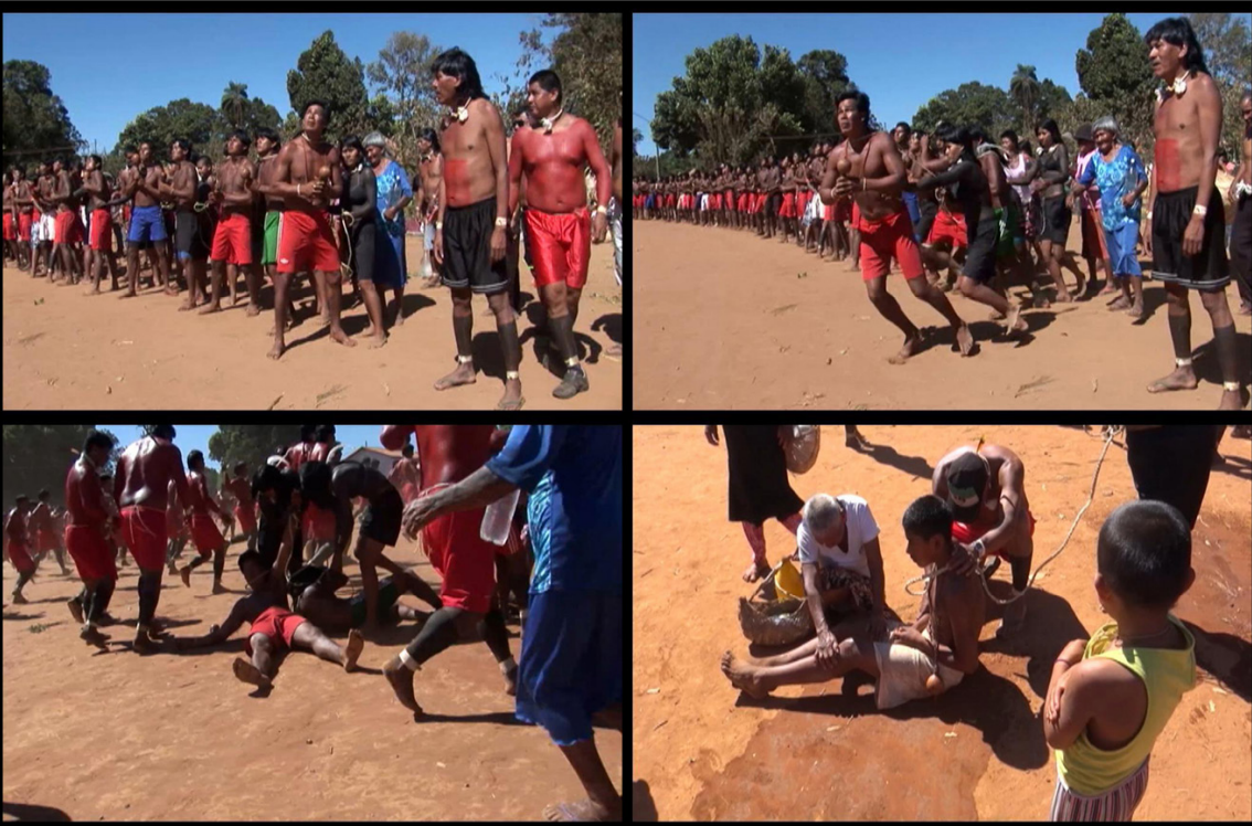
Figura 08 – Sequência do desmaio cerimonial durante o ritual darini .