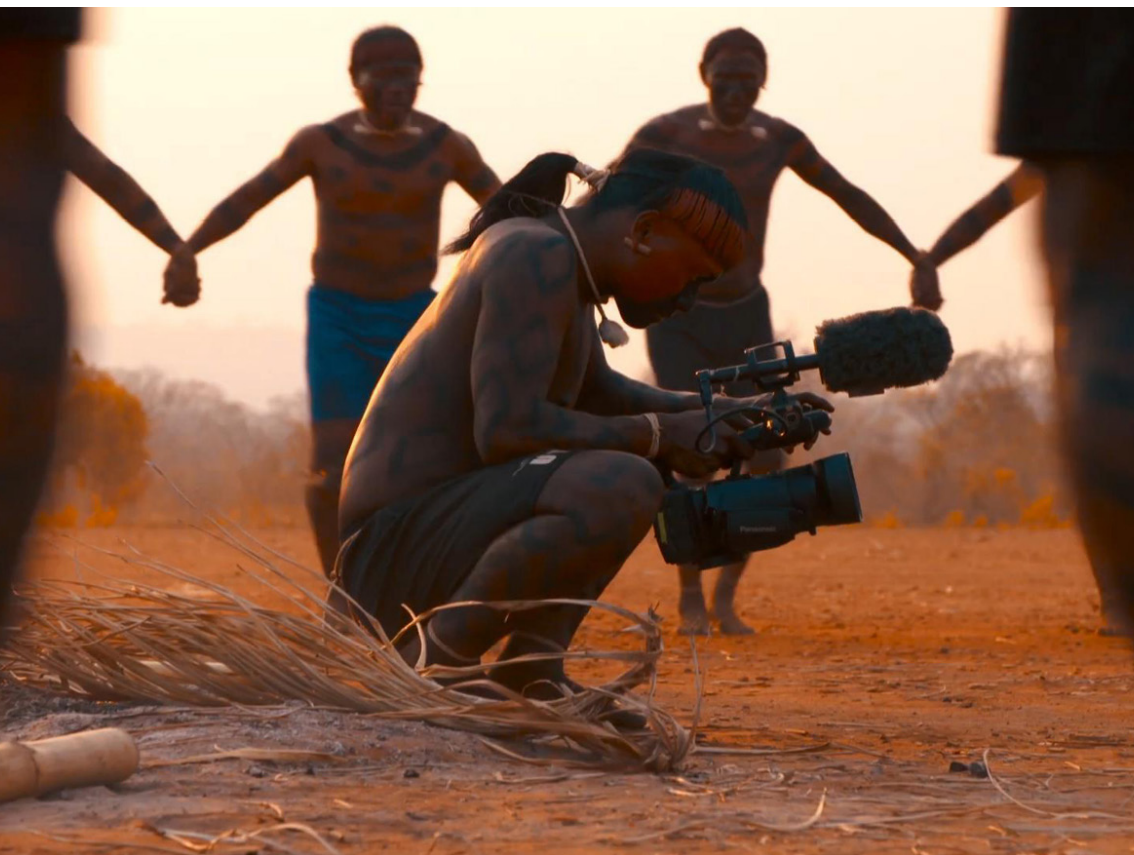
Figura 04 – Utebrewê Xavante durante gravação do curta-metragem Wanãridobe . Aldeia Etenhiritipá.