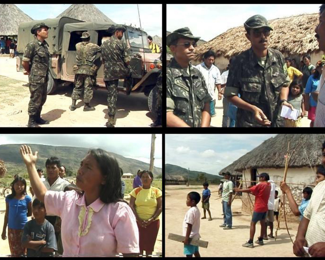
Figura 11 – Com "câmera em presença", moradores contestam militares.