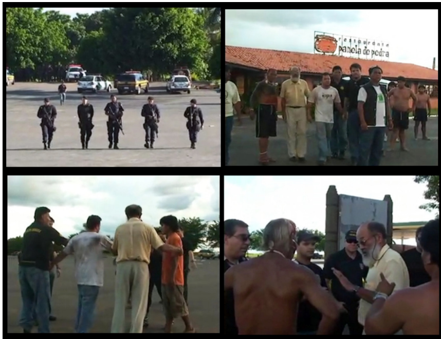
Figura 10 - Negociação entre Xavante e a Polícia Federal.

Fonte: Frames do filme Prisão e libertação de jovem xavante , 2009.