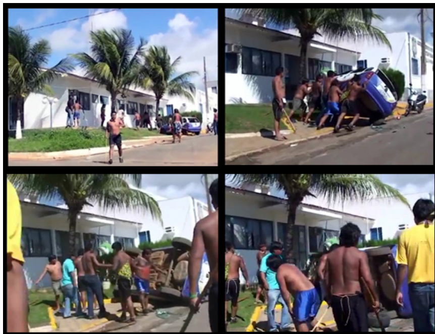
Figura 09 - Indígenas Xavante realizam ação na delegacia de Primavera do Leste, MT.