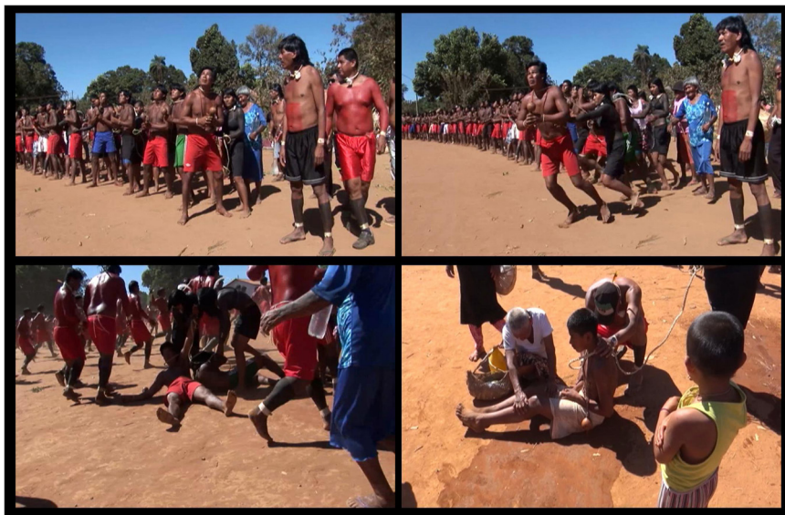
Figura 08 – Sequência do desmaio cerimonial durante o ritual darini .