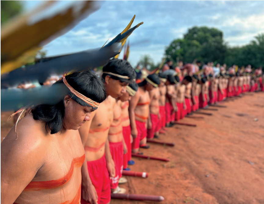
Waptés (adolescentes) durante uma das fases do processo cerimonial de iniciação xavante - Aldeia Sangradouro/2025.