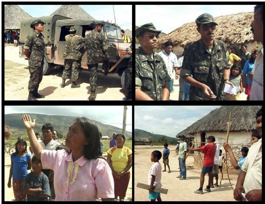
Figura 11 – Com “câmera em presença”, moradores contestam militares.